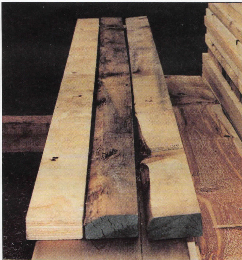
Slika 3: Izgled LVL-a i elemenata od masivnog drveta

Da bi se uporedio LVL sa rezanom građom, urađena je računarska simulacija čiji su rezultati prikazani u tabeli 2.