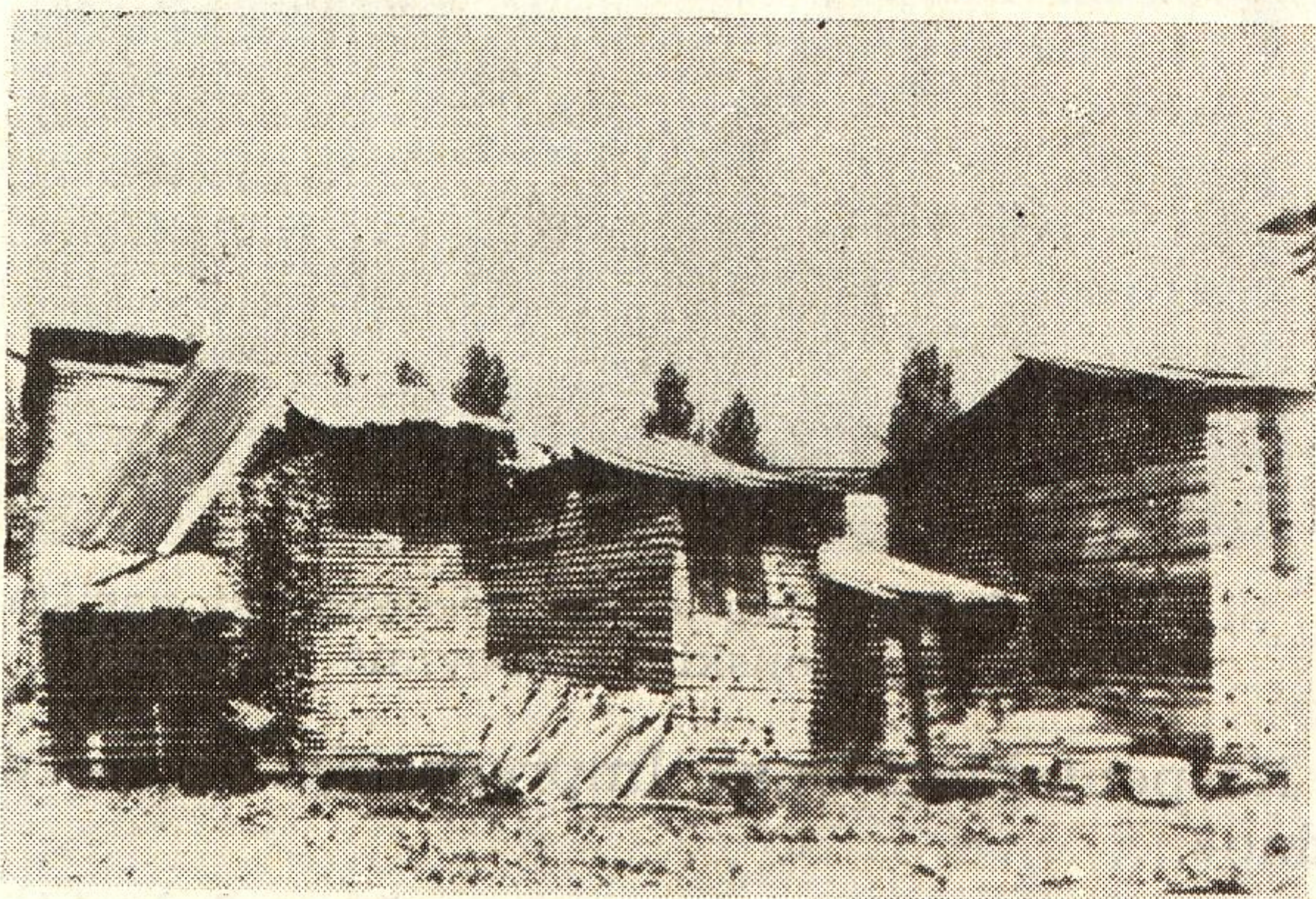
Sl. 92 — Čuvanje vitlova bez odstranjenja raznog drvnog otpadka (original)

Podmetače između komada građe u vitlu, iako su impregnisani, treba pred ponovnu upotrebu površinski sterilisati. Dobra je sterilizacija 5% vodenim rastvorom karbolne kiseline, ili 5% razblaženjem formalina. Najbolje je sredstvo 5% rastvor Na-pentahlorofenata. Potapanje podmetača u bazene sa hladnim rastvorom traje 30 minuta, pri čemu komadi koji se tretiraju moraju biti potpuno potopljeni. Cilj je ove sterilizacije da se uništi površinska mikoflora.