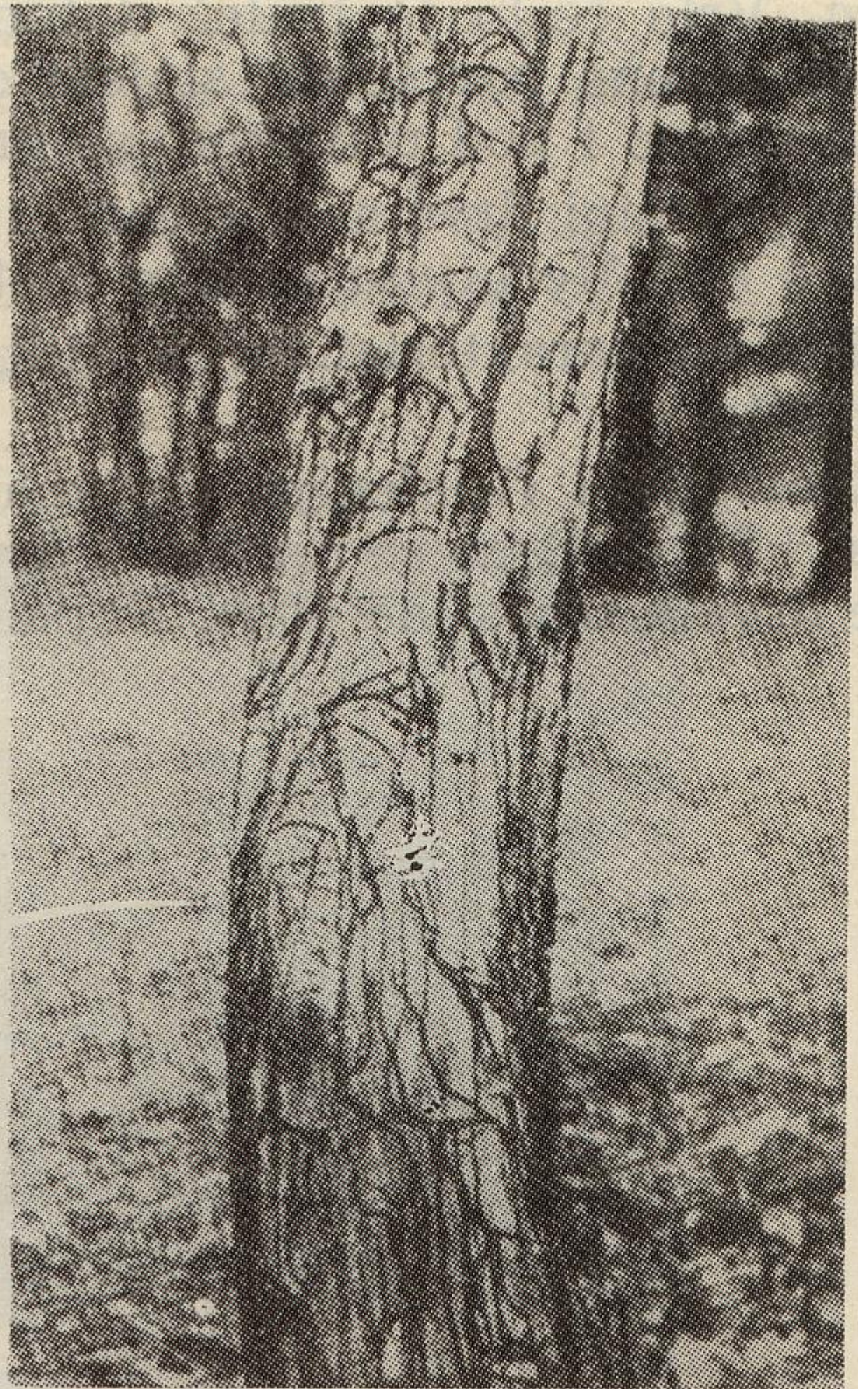
Sl. 67 — Armillaria mellea : levo: karpofore u pridanku stabla ariša; desno: rizomorfe na borovom stablu (prema Cartwrightu i Findlayju)

Problem je za lišćarske (prvenstveno hrast) i četinarske šume, kao i rasadnike. U trupcima se razvija pod vrlo vlažnim uslovima. Ova trulež potiče bilo iz stabla ili kada trupac duže leži u dodiru sa zemljom zaraženom od A.mellea .