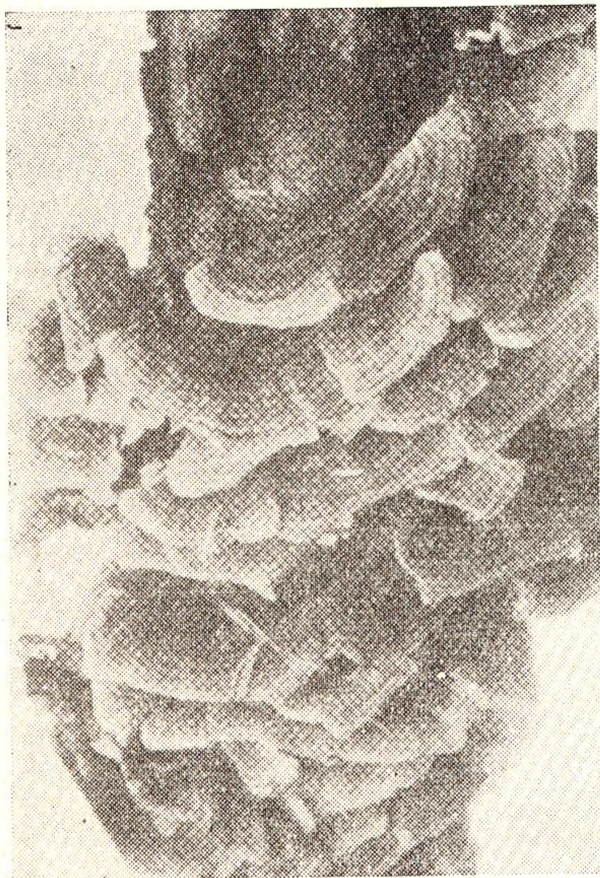
Sl. 46 — Karpofore gljive Coriolus versicolor (prema Overholtsu)

Razlaganje drvene membrane je proučavano od više autora. Izgleda da se prvo razlažu pentozani i lignin. Prema Lutz u, red razlaganja