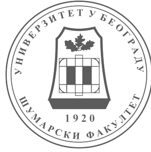
Шумарски факултет, Београд